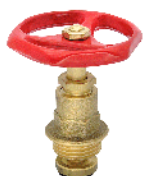
K-294T Vršok ventilu