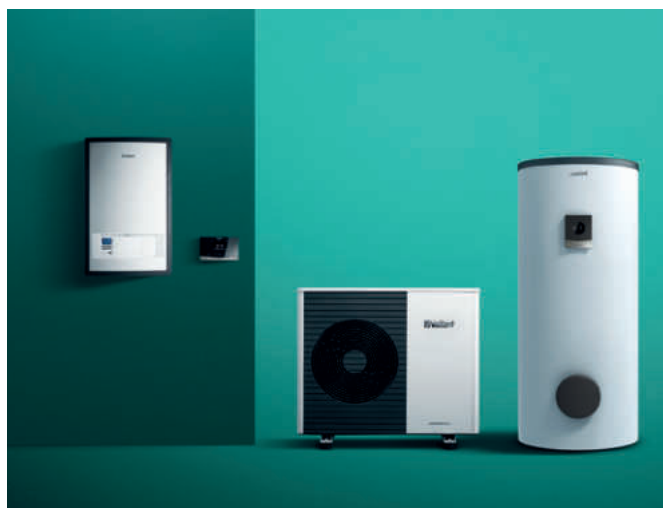
Tepelné čerpadlo aroTHERM plus, externý zásobník teplej vody uniSTOR, závesný hydraulický modul, systémový regulátor sensoCOMFORT