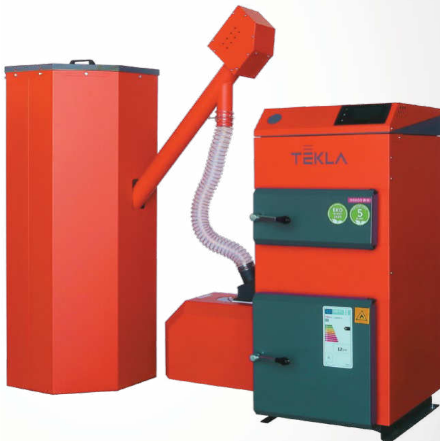
FOTOGRAFIE V KATALÓGU SÚ LEN INFORMAČNÉ. PREZENTOVANÝ KOTOL DRACO BIO 12

DRACO BIO je séria kotlov, ktorá sa osvedčila už rokmi a je založená na veľmi efektívnom a účinnom jedno-ohniskovom výmenníku tepla. Horák na pelety série FIREBLAST je vyrobený zo žiaruvzdornej ocele a používa sa v kotloch série BIO. Na mriežke horáka sú otvory, ktoré zabezpečujú prívod vzduchu potrebného na spaľovanie. Výmenník kotla je vyrobený z vysoko kvalitnej certifikovanej ocele s hrúbkou 5 mm. Správnu činnosť kotla riadi moderný elektronický regulátor s veľkou farebnou dotykovou obrazovkou LCD.