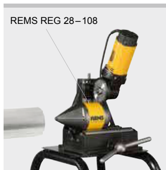
REMS REG 28–108