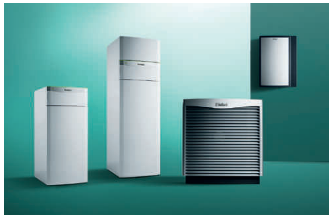
flexoTHERM exclusive, flexoCOMPACT exclusive, aroCOLLECT, hydraulický modul

S produktami Green iQ môžete ušetriť prostredníctvom štátnych dotácií z programu Zelená domácnostiam na podporu využívania ekologických zdrojov.