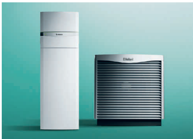
flexoCOMPACT exclusive, vonkajšia jednotka aroCOLLECT