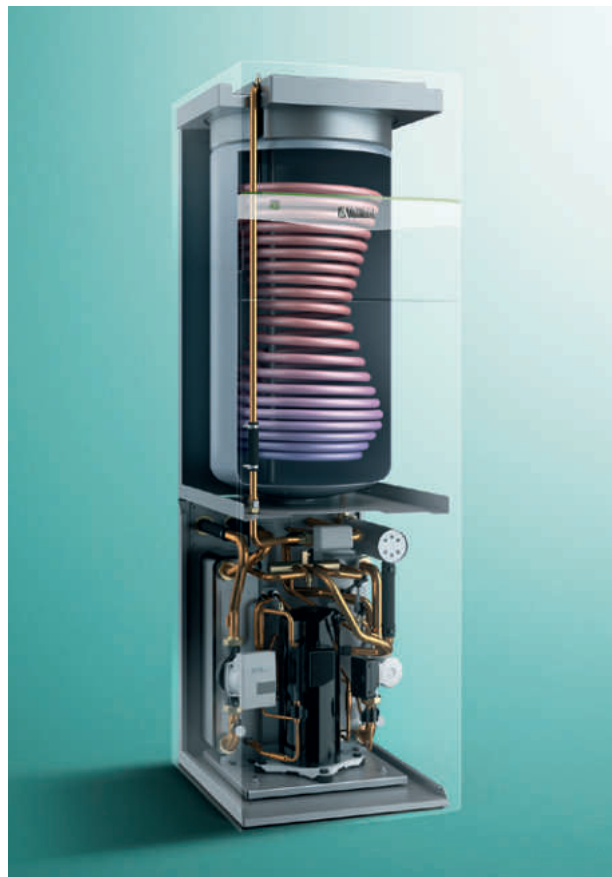
flexoCOMPACT exclusive s integrovaným zásobníkom teplej vody