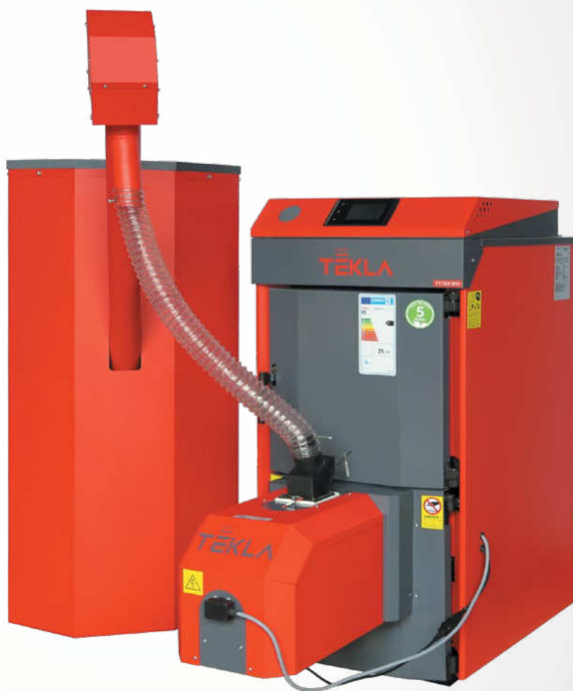
FOTOGRAFIE V KATALÓGU SÚ LEN INFORMAČNÉ. PREZENTOVANÝ KOTOL TYTAN BIO 25

TYTAN BIO je liatinový kotol vybavený automatickým horákom na pelety. Liatinový výmenník kotla sa vyznačuje vysokou odolnosťou proti korózii, a tým aj dlhou životnosťou (10-ročná záruka). Modulárna štruktúra výmenníka umožňuje prípadné rozšírenie kedykoľvek počas jeho činnosti. Hlavnou výhodou kotla je moderné riešenie toku spalín. Výmenník kotla je navrhnutý tak, aby cirkulácia spalín bola maximálne predĺžená (4 komorový odťah spalín), čo výrazne zvyšuje účinnosť pri súčasnom obmedzení tepelných strát v komíne. Kotol je vybavený modernou elektronickou reguláciou s veľkou farebnou dotykovou obrazovkou LCD.