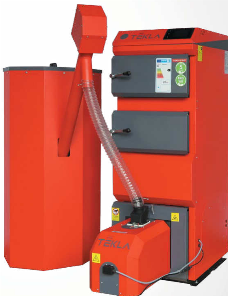
FOTOGRAFIE V KATALÓGU SÚ LEN INFORMAČNÉ. PREZENTOVANÝ KOTOL DRACO D BIO 22

DRACO D BIO je popredným modelom kotla série BIO, ktorého konštrukcia je založená na veľmi účinnom jedno-ohniskovom výmenníku tepla, v ktorom sa zväčšila plocha na odber tepla. Kotel používa samočistiaci horák na pelety vyrobený zo žiaruvzdornej ocele, inštalovaný v predných dverách zariadenia (pre model 50 je horák nainštalovaný na boku výmenníka). Na rošte horáka sa nachádzajú otvory zabezpečujúce prívod vzduchu potrebného na spaľovanie, dodávaný s ventilátorom inštalovaným priamo na horáku. Kotel je vyrobený z vysoko kvalitnej certifikovanej ocele s hrúbkou 8 mm. Správnu funkciu kotla riadi moderná regulácia s farebnou dotykovou obrazovkou LCD, estyma igneo touch.