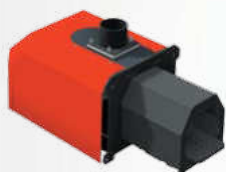
Horák na pelety FIREBLAST s automatickým čistením