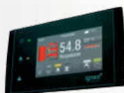
Dotykový regulátor kotla ESTYMA TOUCH v štandarde